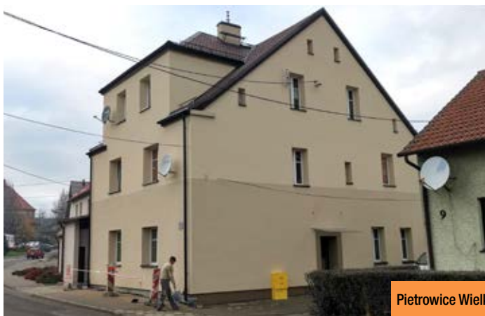
Pietrowice Wielkie, ul. 1 Maja 11