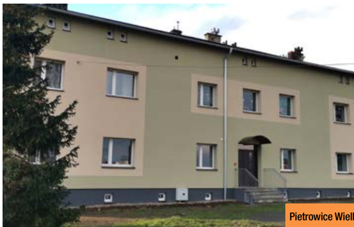
Pietrowice Wielkie, ul. Fabryczna 21