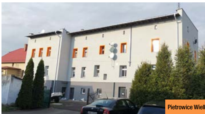
Pietrowice Wielkie, ul. 1 Maja 16