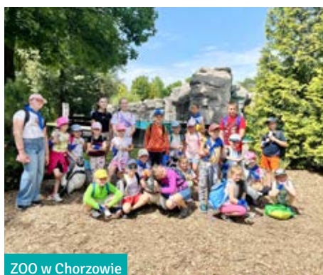
ZOO w Chorzowie