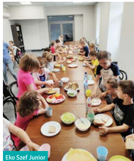
Eko SzeF Junior