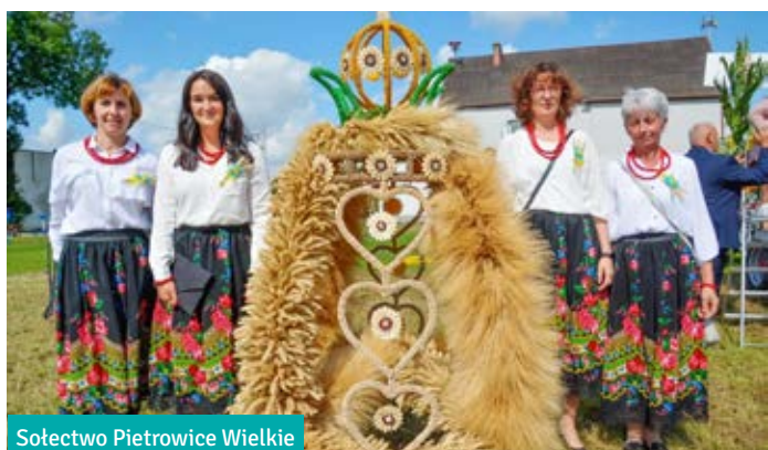
Sołectwo Pietrowice Wielkie