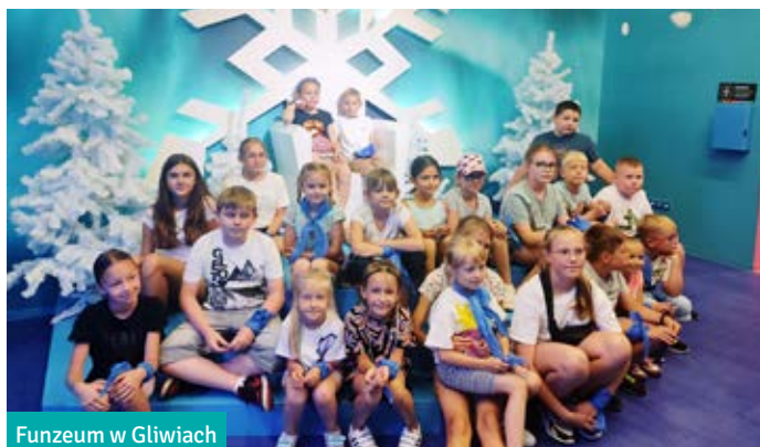
Funzeum w Gliwiach