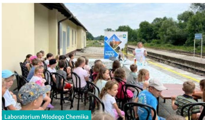
Laboratorium Młodego Chemika