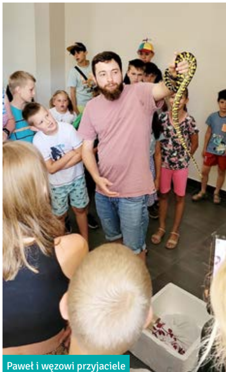
Paweł i wężowi przyjaciele

Nie zapominamy również o młodzieży, zorganizowane zostały dwa wyjazdy na Paintball do Rybnik – Kamień w ramach „młodzieżowych piątek”. Nie zabrakło również kin plenerowych dla wszystkich mieszkańców. Na nudę nie można było na-