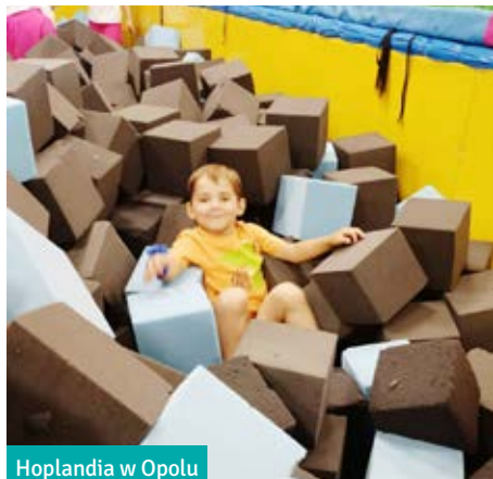
Hoplandia w Opolu