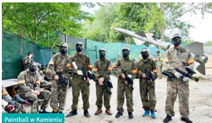
Paintball w Kamieniu