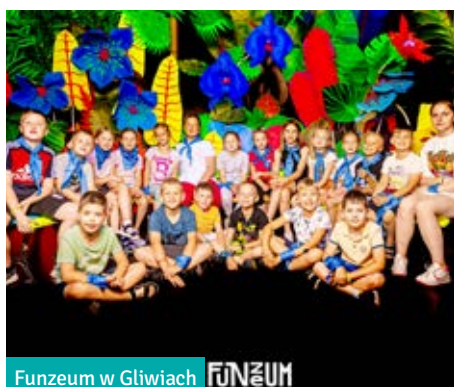
Funzeum w Gliwiczach FUNZEUM