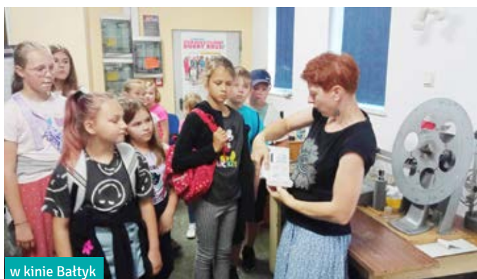
w kinie Bałtyk