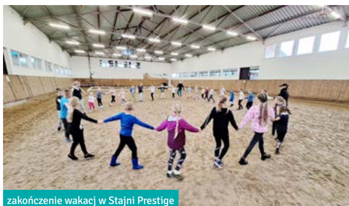
zakończenie wakacji w Stajni Prestige